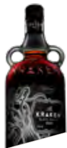
KRAKEN DARK LABEL